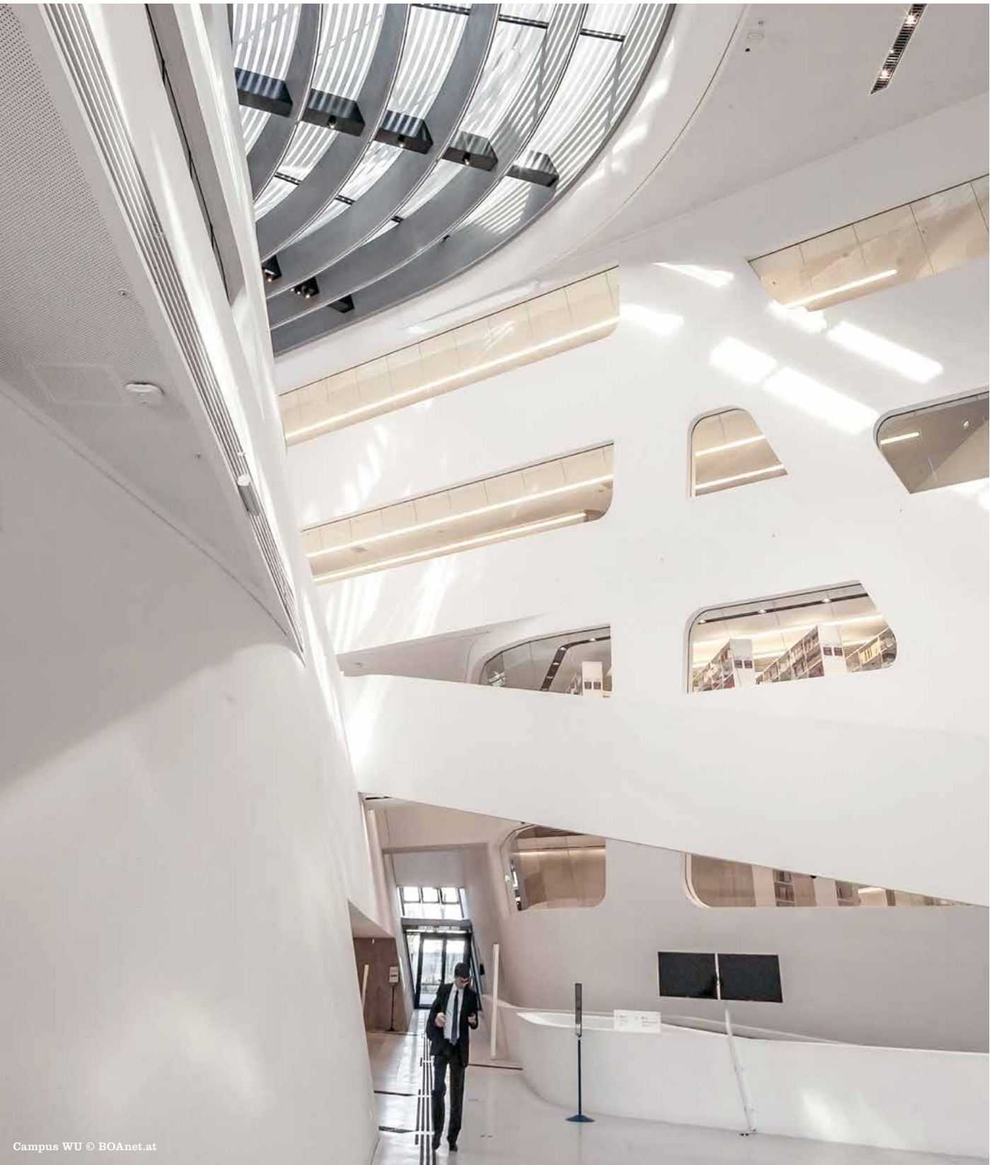
Campus WU